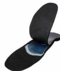
ErgoPad® work:h, teilverklebt